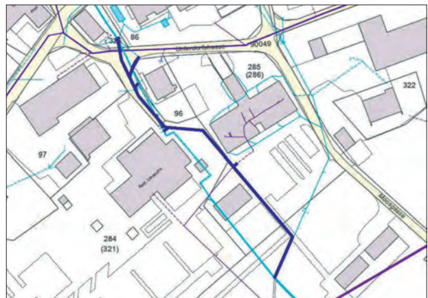
Schulgässli unterer Bereich