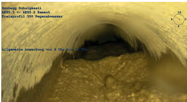
Verkalkte Regenabwasserleitung Schulgässli